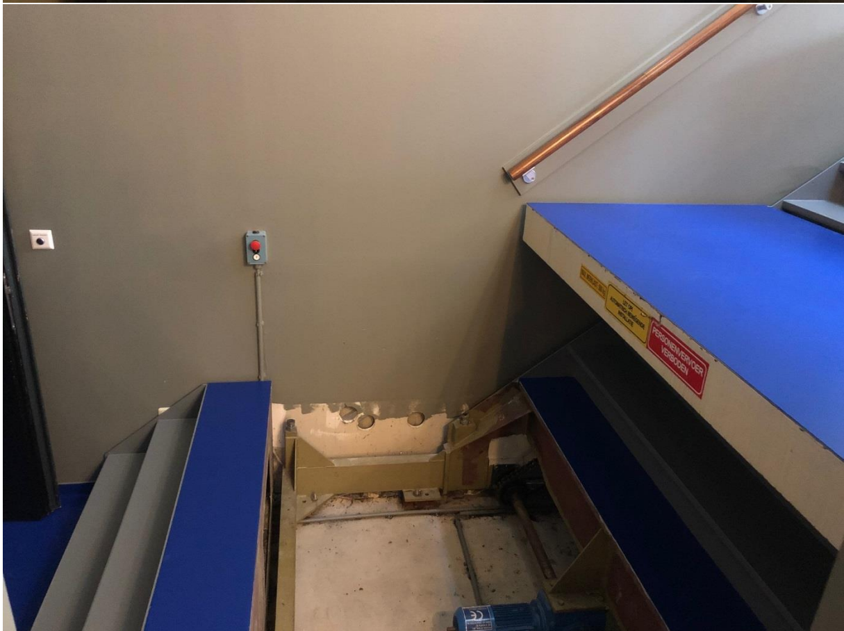
Laatste drie treden via ramp